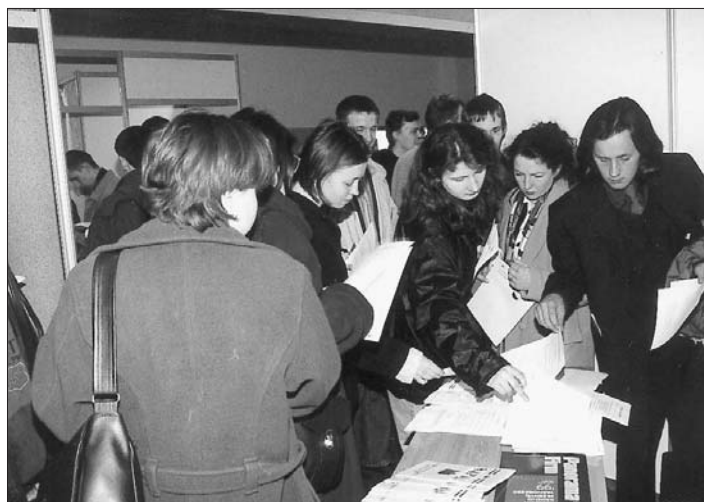
Studenci podczas targów

Organizując targi, staraliśmy się również umożliwić znalezienie pracy osobom niepełnosprawnym, które są wśród nas. W tym też celu zaprosiliśmy przedstawiciela Urzędu Miasta Rzeszowa ds. opieki społecznej i zdrowotnej, a przedstawiciele firm, zainteresowani zatrudnieniem osób niepełnosprawnych, mogli otrzymać od niego informacje na temat korzystania z ulg w ramach programu PFRON.