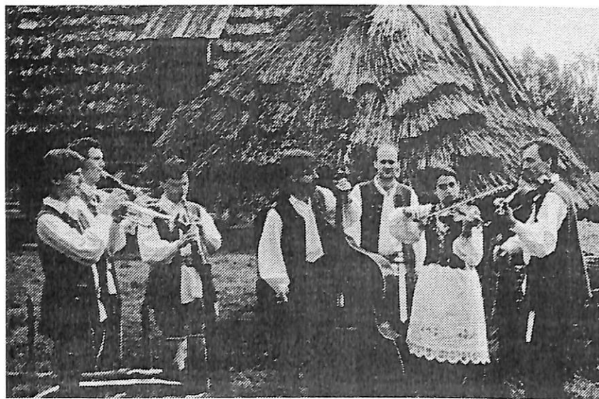
Nasza kapela w skansenie w Sanoku - czerwiec 1993 r.