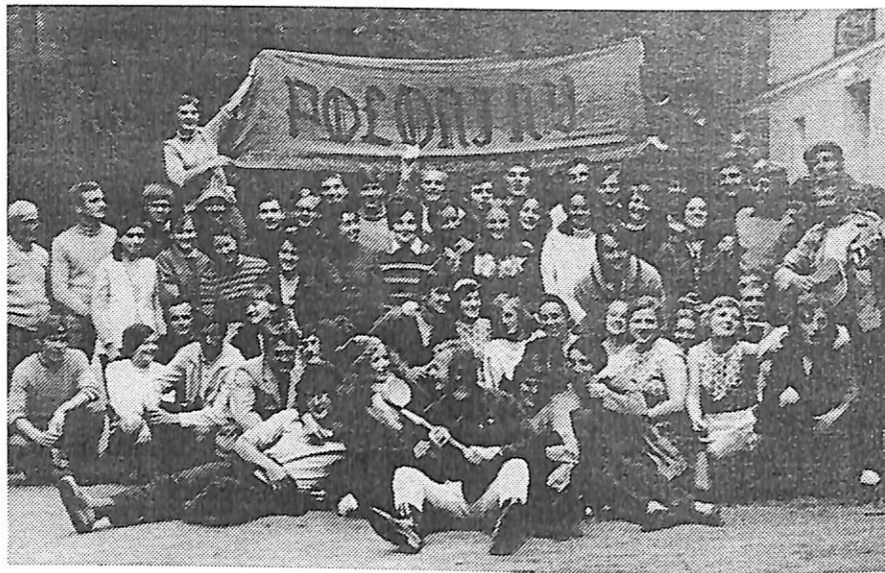
Łądek Zdrój - obóz "Połonin" - lipiec 1972 r.

W skład Zespołu liczącego obecnie ponad 120 osób wchodzi 4 grupy taneczne, grupa wokalna oraz kapela, a jej trzon stanowią studenci Politechniki Rzeszowskiej. W swoim repertuarze