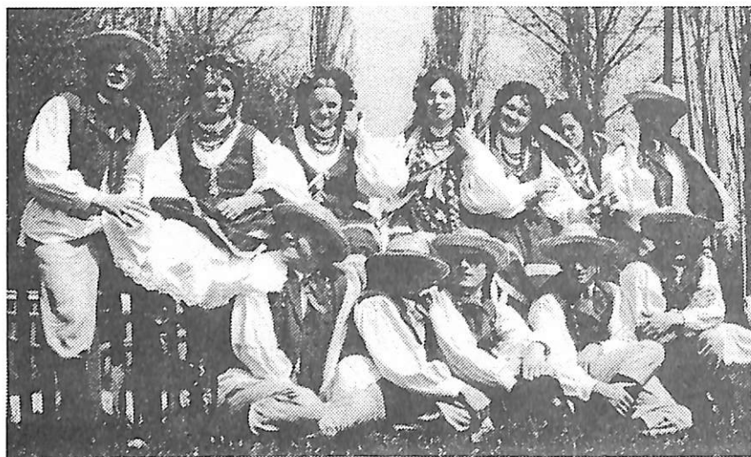
"Połoniny" - maj 1973 r.