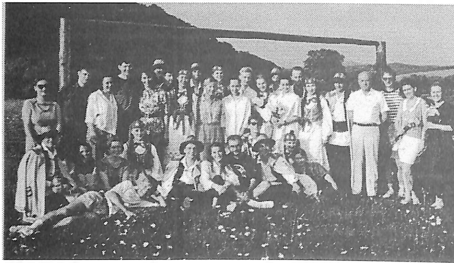
"Połoniny" nad Sanem - czerwiec 1993 r.