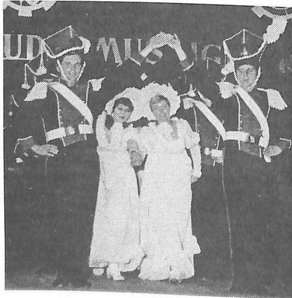
Inauguracja roku akademickiego 1970/1971

"Furmani" - pieśń tańce Łachów Sąddeckich tańce z Podlasia tańce podhalańskie wstęp rzeszowski tańce lasowiackie tańce rzeszowskie od Staremieścia tańce Pogórza i okolic Przeworska finał rzeszowski