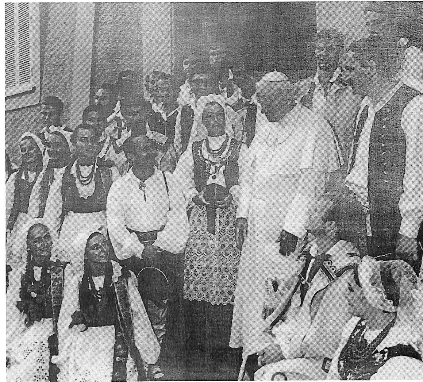
Spotkanie "Połonin" z papieżem Janem Pawłem II, Castel Gandolfo - lipiec 1989 r.